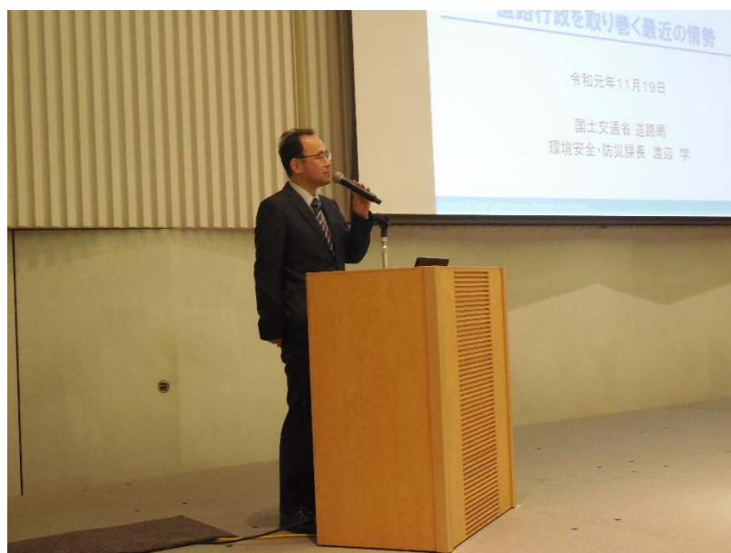
吉田敏晴 国土交通省道路局交通安全政策分析官の講演