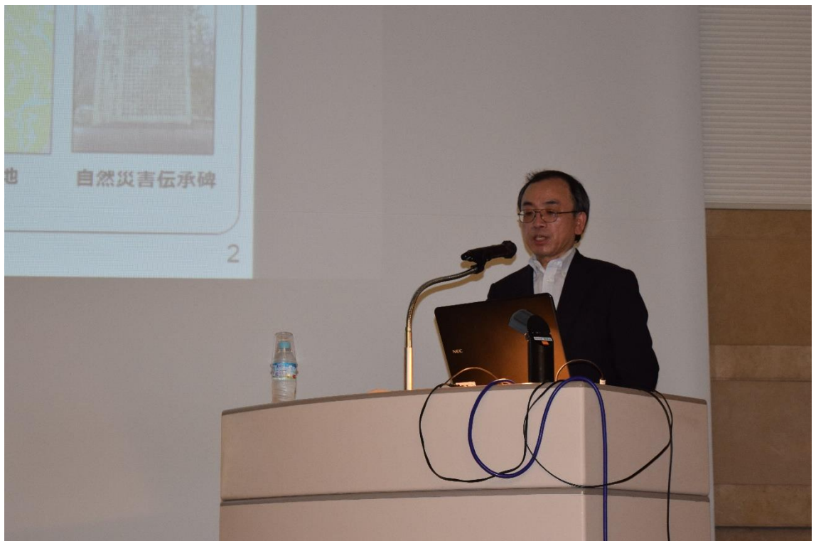
川崎茂信 国土交通省国土地理院長の講演