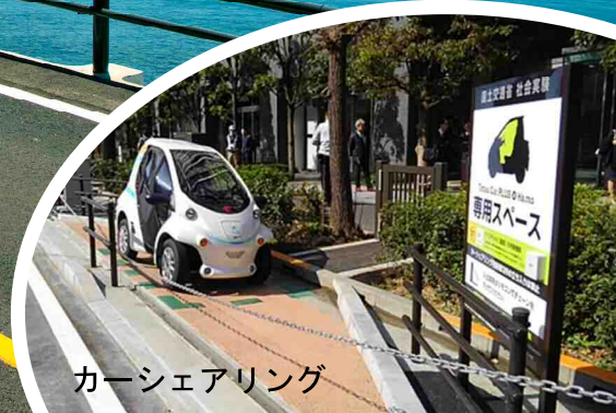
カーシェアリング