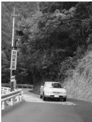
対向車接近情報システム（高知）

ITS（「草の根 ITS」）が必要という視点で取り組んでいる。路面電車が交通島のないところに停まる「ノーガード電停」における歩行者の保護システムや、道路狭隘部の対向車接近表示システムで効果を上げている。必ずしもハイテクは必要ではなく、安価で、地域性を考慮したシステム作りが必要。高知は高齢化、過疎化では進んでいるので、全国に先んじてそのような社会に適合したシステムが出来るかもしれない。それを達成する担い手として、地域の企業の出番がある。また、二重投資を回避するための地域 ITS 情報センターといったものも必要。