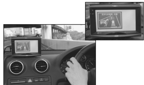
スマートウェイ 2007 合流サービス

（文責：国土交通省国土技術政策総合研究所高度情報化研究センターITS研究室長 平井節生）