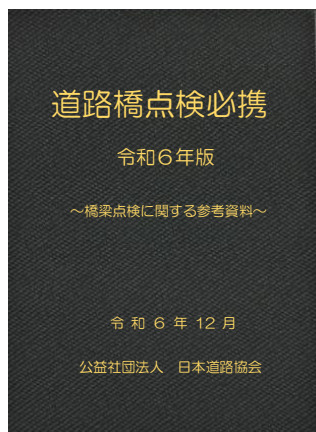
イメージ(上段：電子版、下段：紙版)

【発行】公益社団法人 日本道路協会 〒100-8955 東京都千代田区霞が関 3-3-1 お問合せ: TEL 03-3581-2211 FAX 03-3581-2232